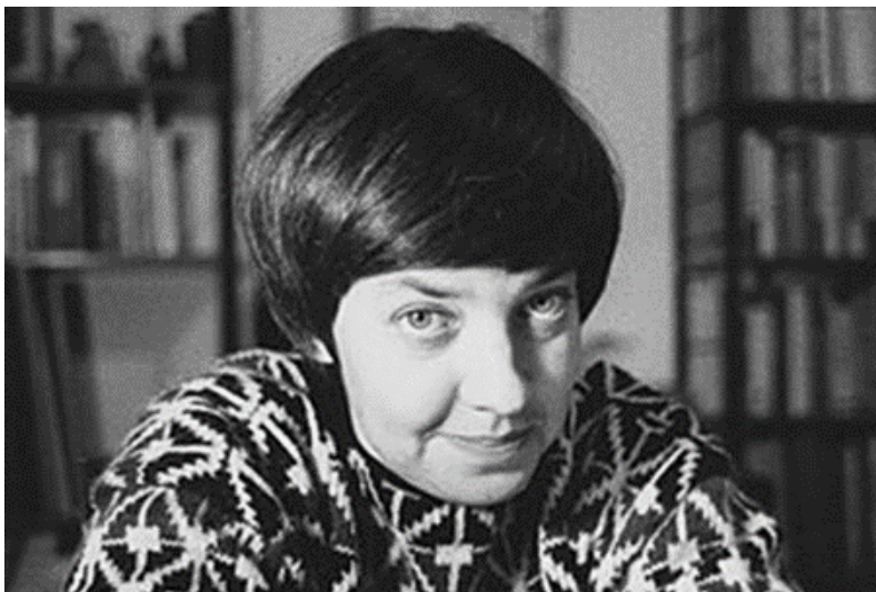
María Elena Walsh en 1952